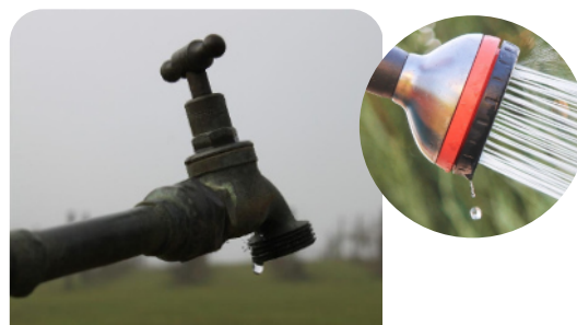
Un robinet qui goutte, c'est plus de 30 000 litres perdus !

Afin d'impulser une dynamique et être gage de réussite, le Syndicat Eyrieux Clair s'est associé à l'ALEC07 pour accompagner les collectivités dans cette démarche vertueuse.